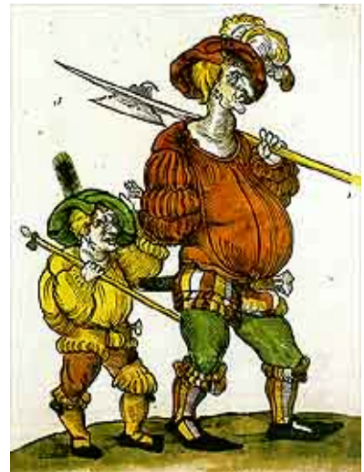
"Landsknecht und Trossbube", Einblattholzchnitt, um 1521. aus: Burschel, Peter: Söldner im Nordwestdeutschland des 16. und 17. Jahrhunderts. Sozialgeschichtliche Studien, Göttingen: Vandenhoeck und Ruprecht 1994, S. 15.

Das zeigt sich ganz deutlich an den «Volksanfragen», einem konsultativen Instrument der Zürcher Regierenden. Zwischen 1495 und 1513 ging es nicht weniger als siebenmal (!) um die