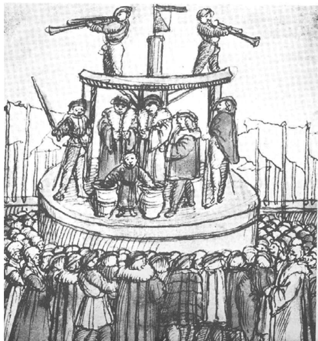
Lotterie aus dem sogenannten „Glückshafen“ am Schützenfest in Zürich im Jahre 1504.

Wie in der Ausschreibung angekündigt, wurde der Glückshafen am letzten Tag des Schiessens geschlossen und « uff des heiligen krütz abend zü herbst », also am 16. September 1504, fand das « usnemen der zedlen us dem glückshafen » statt – die öffentliche Ziehung. In der auf ungefähr 1506 datierten Kopie der Bilder-Chronik Edlibach findet man neben der Darstellung des Armbrust- und des Büchschenschiessens eine weitere lavierte Federzeichnung die diesen spannenden Moment festhält. Im einen Topf lagen die Tausenden mit Namen beschrifteten Zettel, im anderen genauso viele leere Zettel. In Gegenwart von viel Volk wurden dort die Gewinnlose zugemischt. Dann griff, wie das Ausschreiben von 1472 erklärt, « ein junger, unargwoniger Knab » mit seinen Händen « in beid Häfen ». Er zog überwacht von zwei Abgeordneten des Rates gleichzeitig aus jedem Hafen je einen Zettel, wie auf dem Bild rechts zu sehen. Der Namenszettel wurde verle-