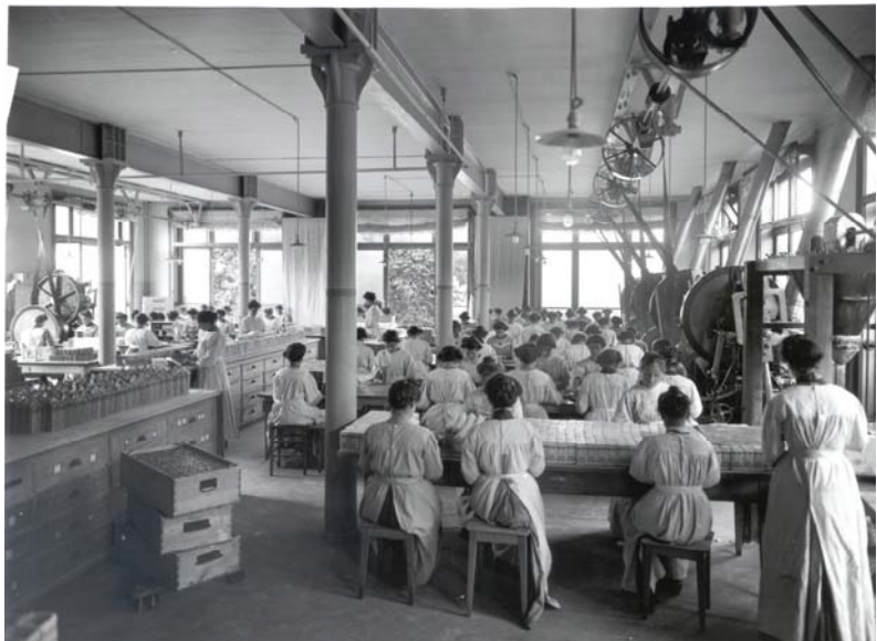
Façonierung Mehle (um 1910)

Diese Räume aber waren für uns Frauen nicht zulässig. Dafür aber wurden wir in das Dampfkesselhaus geführt, woselbst automatisch, regelmässig die Kohlen in den riesig grossen Ofen gelangen, damit dieser stets gleichmässige Hitze erzeuge. In der peinlich säuberlichen Central-Kraftstation gingen wir etwas rascher an all den vielen Maschinen, Kraftleitungen, Krafterzeugern u. Kraftmessern vorbei, als es ein Techniker getan hätte.