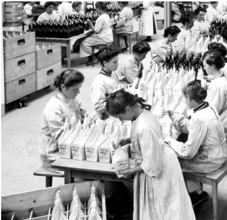
Ausschnitt: Façonierung Würze (März 1914)