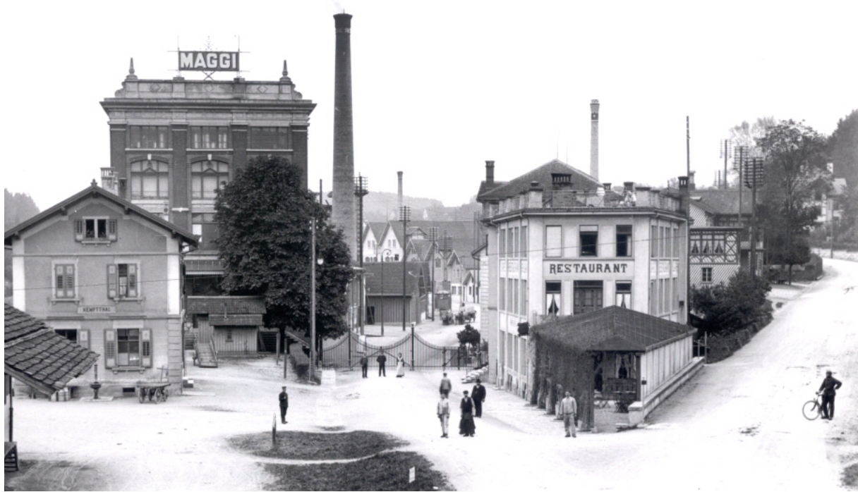
Die Maggi-Fabrik in Kempthal um 1909. Links der Bahnhof, in der Mitte das Werkstor