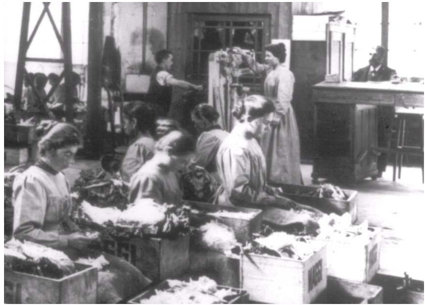
Maschinen sehen keine Schnecken. Die Gemüserüsterei um 1900

Um so lieber hielten wir uns noch in dem Gemüseräumungsbereich auf, in welchem eben Frauen Kerbelkraut sortierten u. reinigten, was eben von Hand geschehen müsste, da die Maschinen weder Schnecken, noch Würmer sehen. Der Kerbel wurde sodann in 3 Wassern gewaschen, in siebartigen Eimern vertropft, sodann in einem grossen Ofen gedörrt, was in Folge der Zirkulation der heissen Luft, den anfangs nassen Kerbel in Verlauf von 2 Stn.