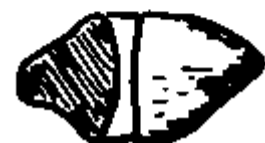
Steinzeitlicher Spinnwirtel aus Schöfflisdorf im Wehntal.