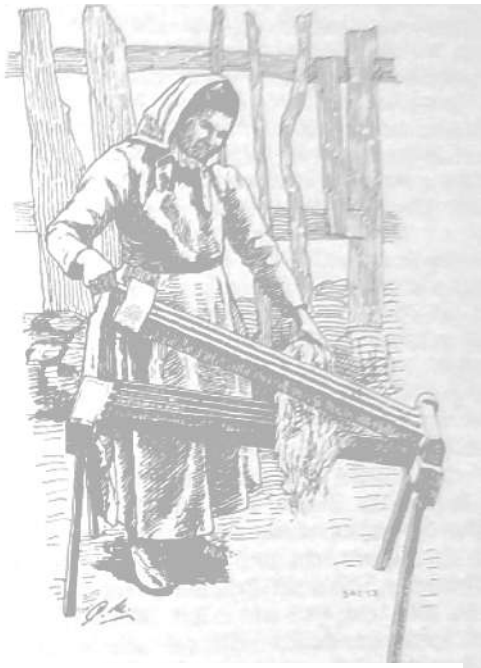
Das Rätchen ging nicht geräuschlos und ohne Staubentwicklung vor sich. (Quelle: SAC Nr. 53 in Wirth 1937)

Dennoch durfte man einige auf dem Weg zur Textilerstellung nötige Verarbeitungsschritte nicht mitten im Dorf erledigen. Dazu gehörten vor allem das Wässern des Hanfes (wegen dem Gestank), das Trocknen im Ofen (wegen der Brandgefahr) sowie das Rätchen (Brechen der Hanffasern; wegen der Ruhestörung und der Staubentwicklung).