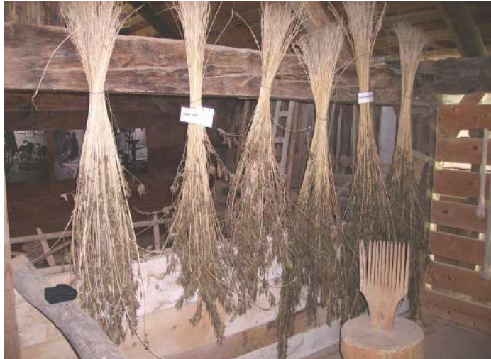
Zum Trocknen aufgehängte Hanfpflanzen, unten eine Riffel (aufgenommen im Freilichtmuseum Ballenberg bei Brienz)

Dass der Hanf gerade im traditionell kleinbäuerlich geprägten Weiach so «stark kultiviert» war, dürfte seinen Grund u.a. darin haben, dass Hanf im Gegensatz zu Flachs selbstverträglich ist, d.h. Hanf wächst mehrere Jahre hintereinander und ohne Ertrags- oder Qualitätseinbusse auf der gleichen Fläche. Das war gerade für Tauner und andere Haushalte mit wenig Landbesitz sehr wichtig. Flachs sollte man nur alle sieben Jahre einmal auf demselben Stück Land anbauen, d.h. zu wenig Ertrag für Textilherstellung (Irniger/Kühn – S. 107).