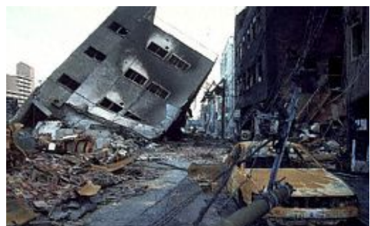
Kobe, Japan 1995