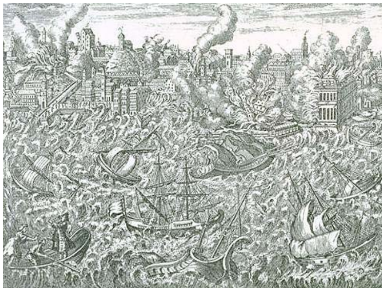
Die Zerstörung Lissabons, 1755. Kupferstich aus der Kozak Collection, Earthquake Engineering Research Center, Universität von Kalifornien, Berkeley

Wenn der sonst feste Boden unter den Füssen zu wanken beginnt, ist das allemal sehr beunruhigend. Man erzählte sich noch lange vom grossen Erdbeben von 1356, das die Stadt Basel vernichtend traf. Und natürlich hörte und las man immer wieder von Erdbebenkatastrophen in fernen Ländern. Sah zuweilen gar bildliche Darstellungen wie diese hier: