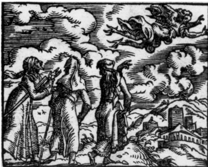
Hexenflug – Titelbild aus Johannes Weyer: "De praestigii daemonum", 1566

Im April 1701 fand das letzte Hexentribunal im Alten Zürich statt. Ein regelrechter Massenprozess: 32 Einwohner von Wasterkingen klagten gegen 13 ihrer Mitbürgerinnen und Mitbürger. Vorwurf: Ausübung von schwarzer Magie in Feld und Stall. Bilanz: 7 Frauen und 1 Mann wurden verurteilt, hingerichtet und verbrannt.