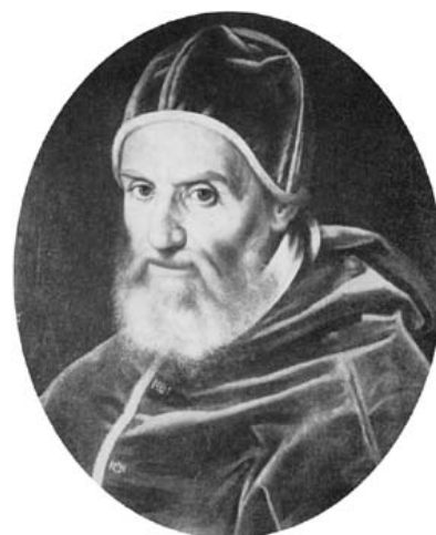
Papst Gregor XIII.

Die Bauern hatten auch sonst keine Freude an der Neuerung. Die Wichtigkeit des alten Kalenders im bäuerlichen Jahresablauf darf nicht unterschätzt werden. Wetterregeln waren fest mit kirchlichen Daten verbunden, Zinsverpflichtungen auf einen bestimmten Tag fixiert. Plötzlich sollte alles um 10 Tage verschoben werden? Das wollte vielen nicht in den Kopf.