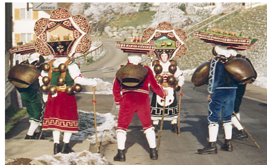
Silvesterkläuse in Schwellbrunn am 13. Januar 1993

«In dem Land Appenzell war der neue Kalender Anno 1584. von beyden Rooden angenommen, daraus aber hernach zwischen den Evangelischen und Catholischen grosse Uneinigkeiten entstanden, daß man bald gegen einander die Waffen ergriffen hätte, bis A. 1590. von denen übrigen Eydgenossen vermittelt worden, daß die Evangelische ihre Festtag wiederum nach dem alten Kalender sollen feyren mögen, gleich dann selbige auch nach der Landes-Theilung diesen Kalender wieder völlig angenommen.»